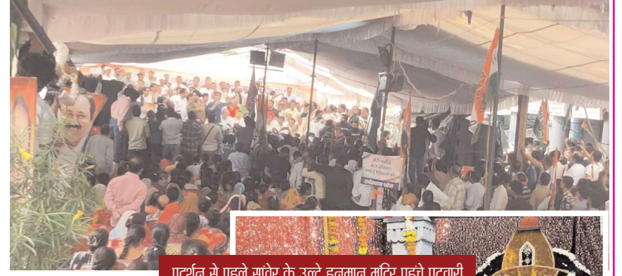
प्रदर्शन से पहले सावेर के उल्टे हनुमान मंदिर पहुंचे पटवारी

इंदौर। बढ़े हुए संपत्ति कर, कचरा संकलन शुल्क, जलकर को वापस लेने और नगर निगम में व्याप्त भ्रष्टाचार में दोषियों के खिलाफ कड़ी कार्रवाई करने को लेकर आज कांग्रेस ने नगर निगम मुख्यालय पर जंगी प्रदर्शन किया इस जंगी प्रदर्शन में बड़ी संख्या में कांग्रेस जन सम्मिलित हुए। इस आंदोलन में भाग लेने के लिए कांग्रेस जन इंदौर ही नहीं महु, देपालपुर सावेर शाहिद ग्रामीण क्षेत्र के विभिन्न ब्लॉकों से आए हुए थे।