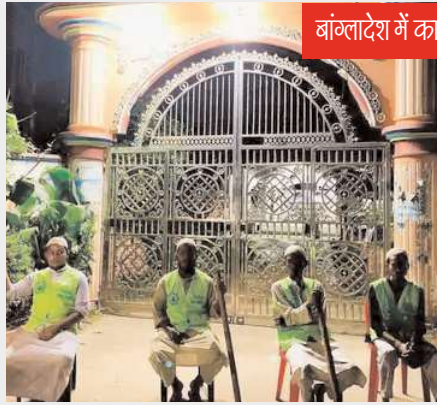
बांग्लादेश में काली मंदिर के बाहर सुरक्षा व्यवस्था संभाल रहे गदरवा के छात्र

जानकारी सर्वदलीय बैठक में विपक्षी नेताओं को दी। सरकार ने बताया कि अभी बांग्लादेश में 12000 से 13000 भारतीय हैं। हालांकि, देश में स्थिति इतनी भयावह नहीं है कि अपने नागरिकों को वहां से निकालना पड़े। सुत्रों के मुताबिक, बैठक में केंद्र सरकार ने बताया कि हम बांग्लादेश में हर स्थिति पर कड़ी निगरानी रख रहे हैं। जो भी स्थिति होगी, उसके बारे में विपक्ष को बताया जाएगा। वहां से करीब 8000 भारतीय स्टूडेंट्स वापस आ गए हैं। बाकी लोगों को निकालने की अभी जरूरत नहीं है। केंद्र सरकार ने कहा कि अभी शोख हसीना पर कोई फैसला नहीं लिया गया है। सरकार द्वारा उठाए गए कदमों से विपक्ष संतुष्ट है।