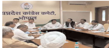
13 अगस्त तक के कार्यक्रम

भोपाल। चुनावों में हार के बाद कांग्रेस अब संगठन को ताकत देने और कार्यकर्ताओं में जोश भरने हफ्ते भर तक लगातार विरोध-प्रदर्शन करेगी। पीसीसी चीफ जीतू पटवारी आज इंदौर में नगर निगम में हुए घोटालों के खिलाफ दिए जा रहे धरना-प्रदर्शन में शामिल होंगे। इंदौर के बाद अलग-अलग जिलों में कांग्रेस शक्ति प्रदर्शन करेगी। कांग्रेस आज से 13 अगस्त तक लगातार अलग-अलग जिलों में धरना प्रदर्शन करेगी। आज इंदौर में नगर निगम में हुए घोटालों के विरोध में प्रदर्शन करेगी। इसके बाद 8 अगस्त को दतिया, 9 अगस्त को भिंड के लहार, 12 अगस्त को सागर और 13 अगस्त को सीएम डॉ. मोहन यादव के