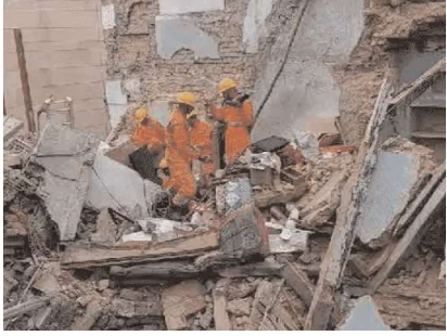
70-80 साल पुराने थे दोनों मकान